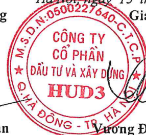
Wương Đăng Phương