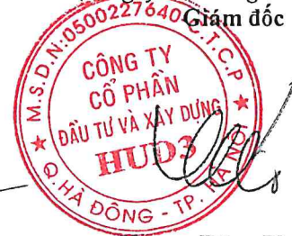
Vương Đăng Phương